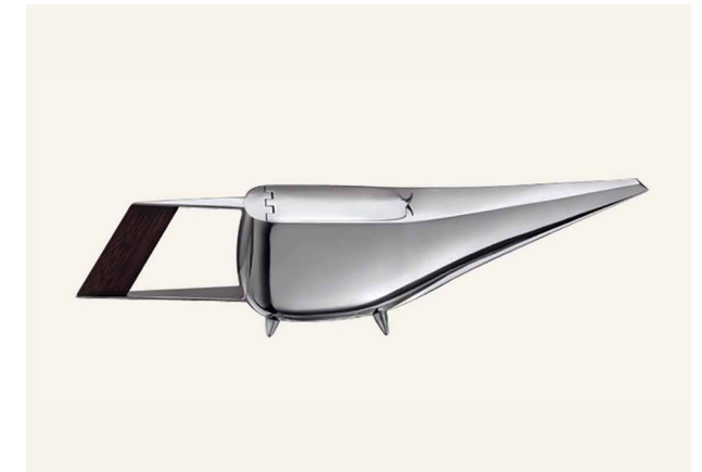
— 8. Gio Ponti, Thèière Aero, 1957, Christofle Paris Patrimoine Christofle