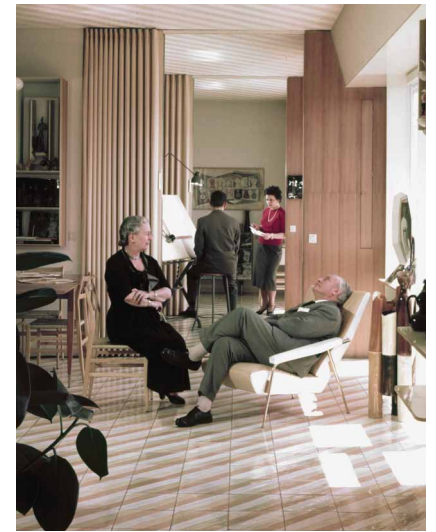
— 6. Gio Ponti et Guilia Ponti, Via Dezza, 1957