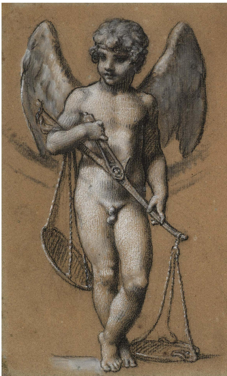
4. Pierre-Paul Prud'hon — Projet pour le piètement du berceau du roi de Rome: La Justice 1810-1811 Pierre noire, craie blanche et estompe sur papier anciennement bleu