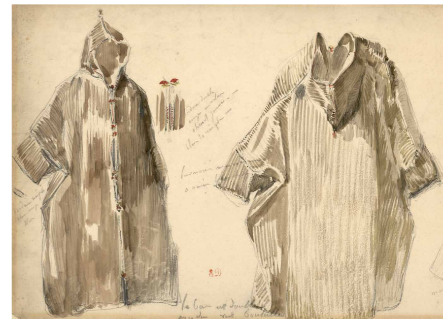
4. Études de burnous, Eugène Delacroix, après 1832, Graphite, lavis brun avec rehauts d'aquarelle rouge sur papier, Acquis à la vente après décès Edgar Degas, 1918, inv. 21153 A

Les quelque 150 000 dessins du Département des Arts graphiques : unica, albums ou carnets, s'imposent comme un ensemble diachronique (XVI-XXI e siècles), esthétiquement homogène (Écoles française et européennes) et formellement pluriel (dans ses supports : vélin ou papier vergés comme ses techniques : pierre noire, sanguine, aquarelle, lavis, plume ou pastel). Par l'exemple, ils prouvent « le beau dans l'utile ».