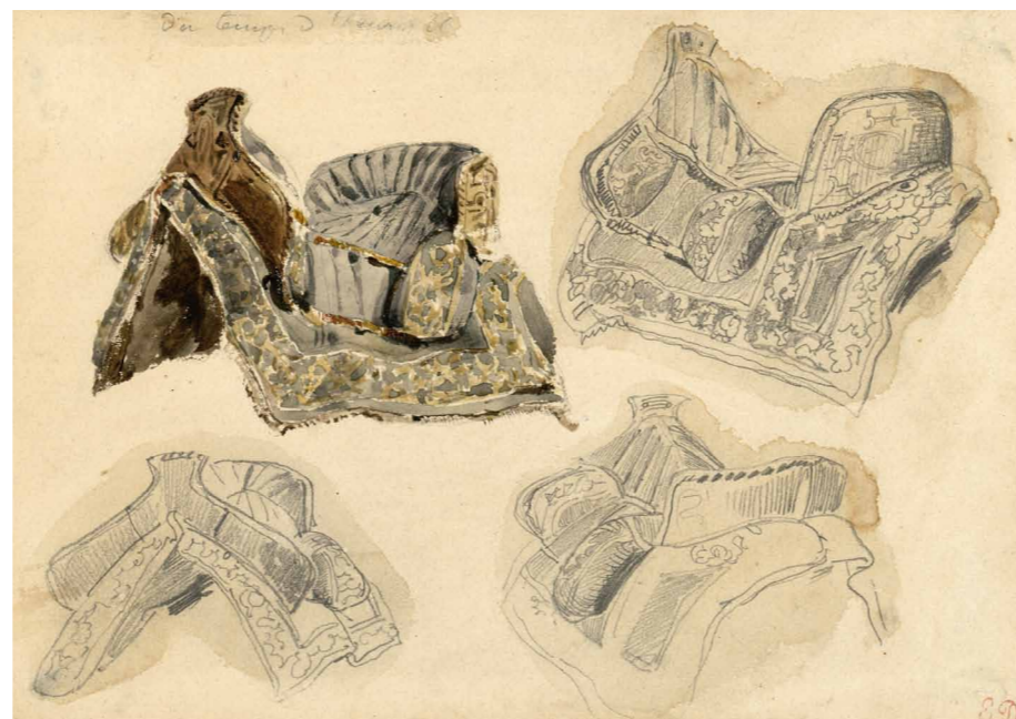
3. Quatre études de selles, Eugène Delacroix, 1825, Crayon et aquarelle, Acquis en vente, 1918, inv. 20951

En 1832, le voyage initiatique d'Eugène Delacroix (1798-1863) au Maroc crée la césure quand le peintre accompagne la mission diplomatique française auprès du sultan Abd Al-Rahman. Et là, au fil du périple, l'artiste devenu dessinateur et ethnographe, consigne ses impressions au format de notes, croquis ou aquarelles, constituant, de cette manière, un répertoire iconique inépuisable de formes et de couleurs témoignant de sa passion pour un Orient aussi réel qu'il est fantasmé. Comme Charles Cournault (1818-1904), l'un de ses élèves et ami, et d'autres peintres à son époque, Delacroix est séduit par l'artisanat de l'Afrique du Nord. Lors de ses pérégrinations, mais aussi dans le cadre d'échanges parisiens, il fait l'acquisition d'objets orientaux, qui, conservés dans son atelier, fonctionnent à la manière d'un réservoir d'idées. Fragments de cuir, séries de textiles, faïences, armes ou bijoux, ils fabriquent du souvenir et nourrissent son inspiration. Les études conservées au Département des Arts graphiques évoquent ce goût en faveur de l'objet, de la science équestre et de l'esthétique des tissus. Selles,