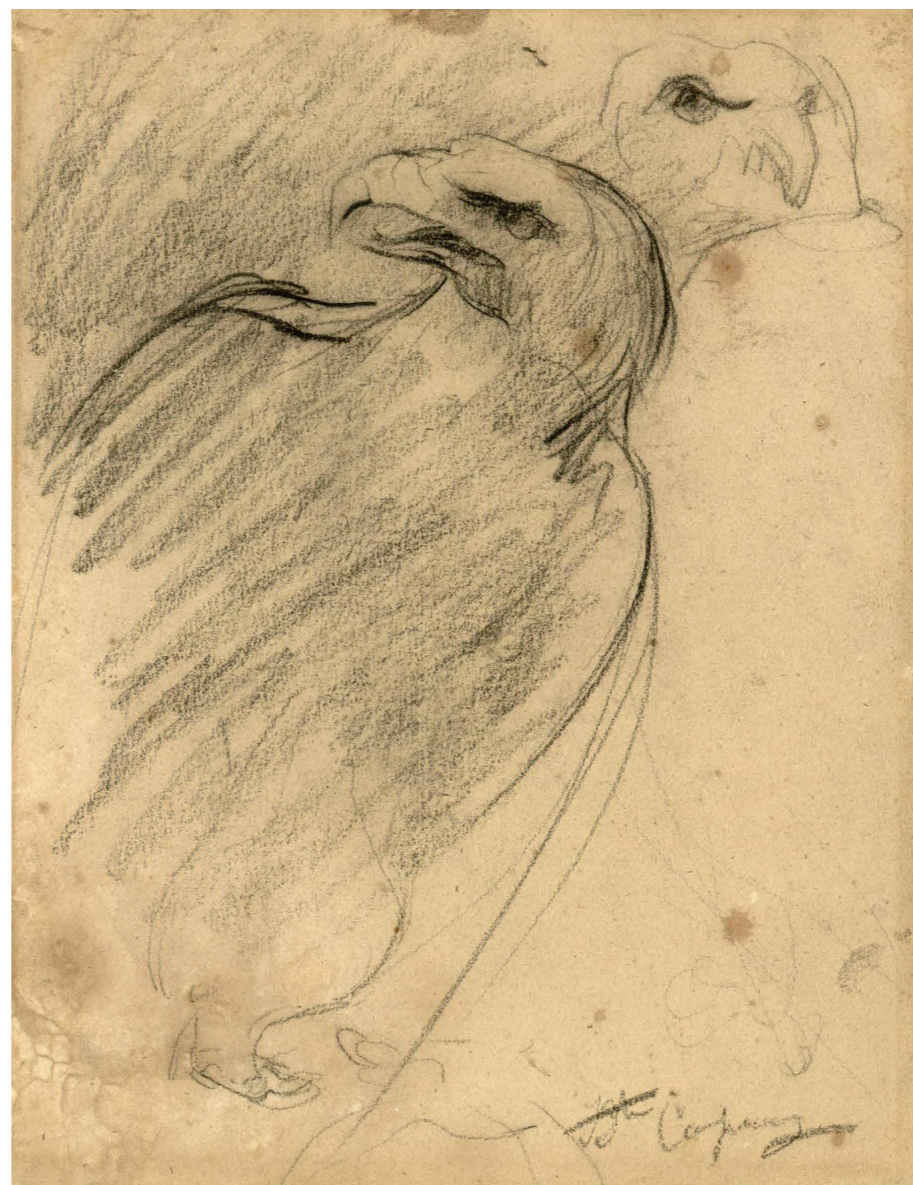
6. Étude d'aigle pour le fronton du pavillon de Flore au Louvre, Jean-Baptiste Carpeaux, Paris, vers 1864-1865, Crayon noir sur papier, Don Raymond Koechlin, 1913, inv. 19339 A4